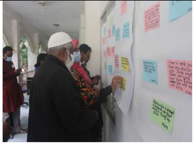
ভোট প্রয়োগের একাংশ