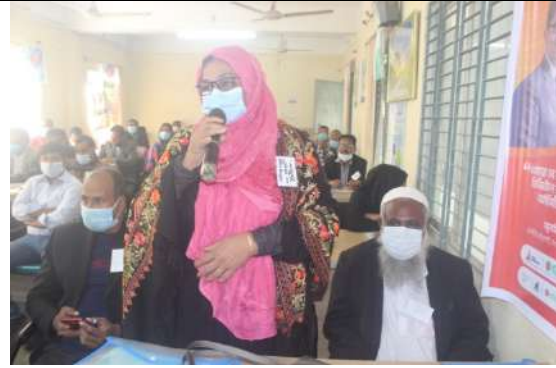
কর্মশালাটি পরিচালনা করছেন ব্রেকিং দ্য সাইলেন্স এর ডিরেক্টর