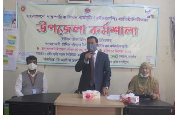
প্রধান অতিথির বক্তব্য দিচ্ছেন চেয়ারম্যান উপজেলা পরিষদ, আশাশুনি