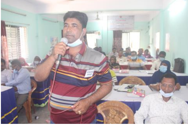
উন্মুক্ত আলোচনায় বক্তব্য রাখছেন চেয়ারম্যান