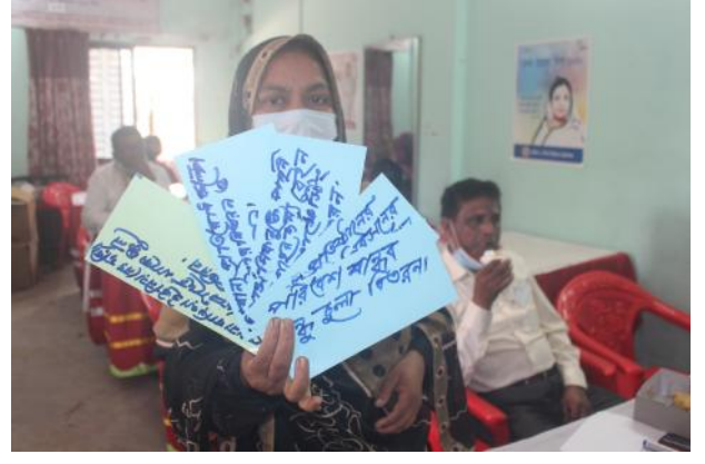
ইউনিয়ন ভিত্তিক ভালো শিখন প্রদর্শন