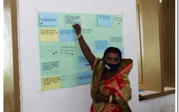
ভোট প্রয়োগ করার একাংশ