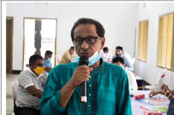
ইউনিয়নের ভিত্তিক ভাল কাজ উপস্থাপন