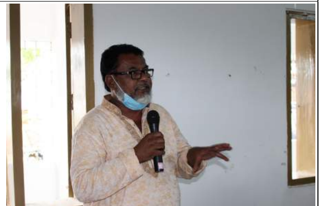
উন্মুক্ত আলোচনায় বক্তব্য রাখছেন চেয়ারম্যান